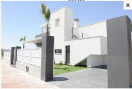
Freistehende Villa in Lorca, Murcia